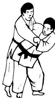
O-goshi (suuri lonkkaheitto)