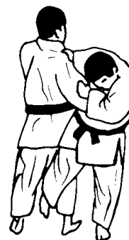
O-soto-gari (suuri ulkopuolinen niitto)