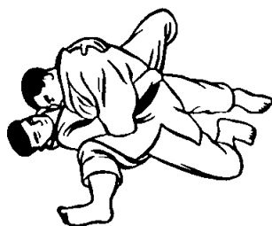
Honkesagatame (perussidonta olkapästä kainaloon)

JU - ystävällisyys, lempeys, pehmeys, joustaminen DO - tie, tapa, polku, periaate DOJO - judosali HAJIME - aloittakaa - komento JUDO GI - judopuku JUDOKA - judon harrastaja REI - kumartaa UKE - liikkeen vastaanottaja UKEMI - kaatuminen TORI - liikkeen suorittaja